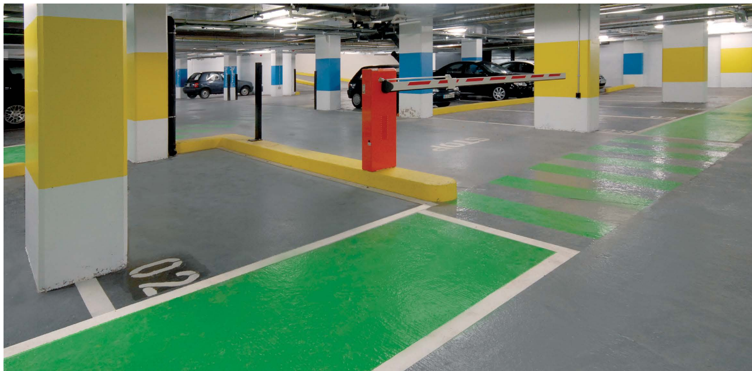
Sikafloor® MultiDur ET-20

Η Sika ως γέφυρα στην αγορά των εποξειδικών συστημάτων δαπέδων, συνεχίζει να αναπτύσσει νέα προϊόντα για να ικανοποιήσει τις απαιτήσεις των πελατών της. Η νέα εποξειδική βαφή Sikafloor®-2640 αποτελεί την τελευταία εξέλιξη στον τομέα αυτό, ως σύστημα χαμηλών εκπομπών πτητικών οργανικών ενώσεων και αδύναμης οσμής, ταχείας ωρίμανσης και με εξαιρετικές ιδιότητες εφαρμοσιμότητας.