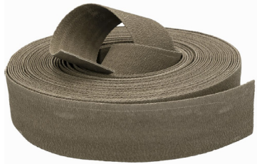
Sika Waterbar® FB-125 Μήκος 50m & πλάτος 125mm

Μια νέα λύση για τη στεγανοποίηση των κατασκευαστικών αρμών σε υπόγειες κατασκευές