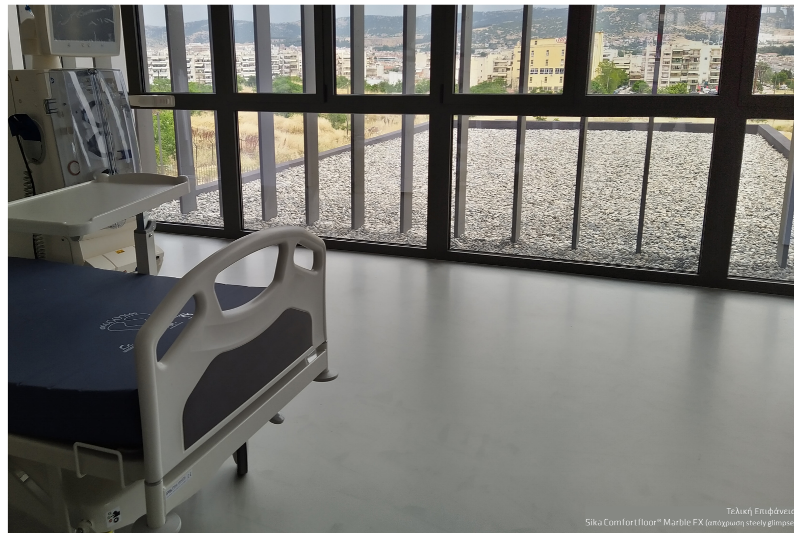
Τελική Επιφάνεια Sika Comfortfloor® Marble FX (απόχρωση steely glimpse)