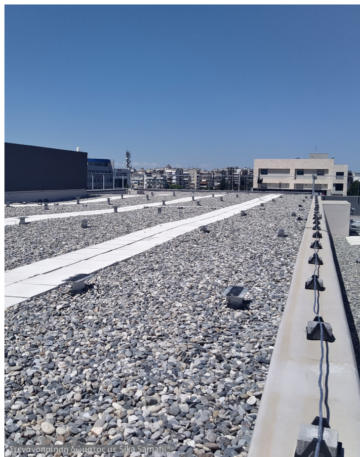
Στεγανοποίηση δώματος με Sika Sarnafil®