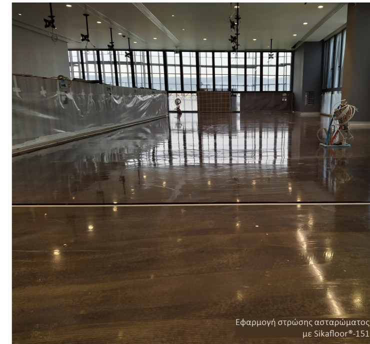
Εφαρμογή στρώσης ασταρώματος με Sikafloor®-151